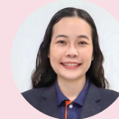
ジantan先生 専門:バイオ工学