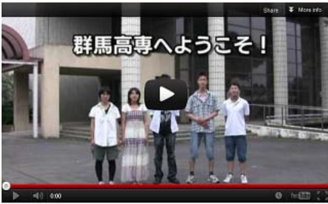
群馬高専紹介動画

平成 23 年度から入試広報を主目的として、本校及び各学科を紹介する「動画で見る群馬高専」を作成し、本校 HP 上に公開している。寮生活紹介用も追加作成されるなど随時更新していく予定である。