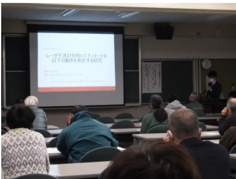
樋口先生のセミナー